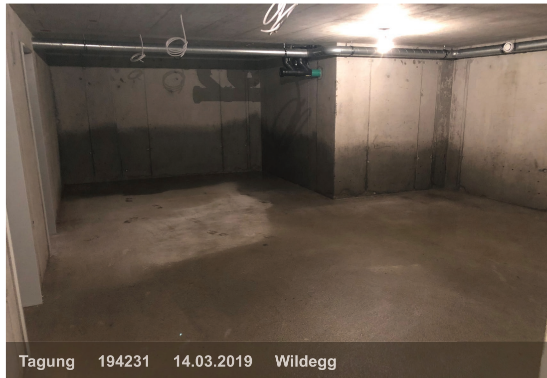
Tagung 194231 14.03.2019 Wildegg

Zielgruppen: Liegenschaftsverwalter, private und öffentliche Bauherren